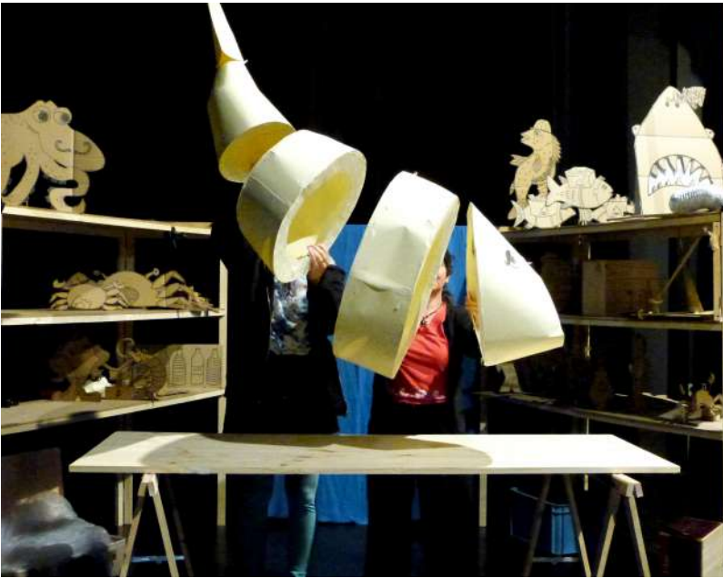
Explorations plateau et essais de scénographie à l'Espace Félix Arnaud à St-Paul-lès-Dax (40), avril 2024.