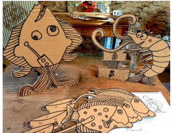
Dans l'atelier, création de prototypes et essais graphiques à valider au plateau, février et avril 2024.