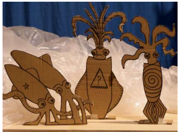
Expérimentations plateau à l'Espace Félix Arnaudin à Saint-Paul-lès-Dax (40), avril 2024.