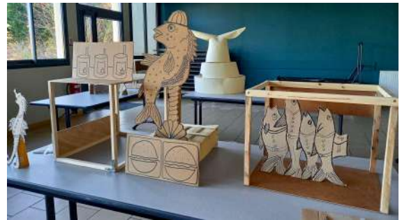
Ebauches de mise en scène dans l'ancienne école de Brassempouy (40), février 2024.

Esquisses et prototypes en carton pour les premières résidences de recherches au plateau.